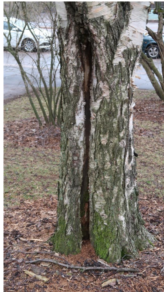
Tien lähellä säilyvä paperikoivu (3) on elinvoimainen, mutta rungossa pieni lahovaurio, seurattava.