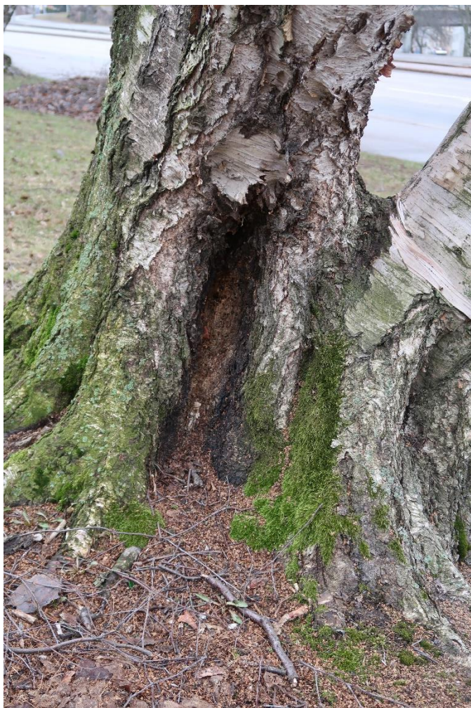
Poistettava paperikoivu (4) on erittäin elinvoimainen, mutta tyvellä on alkava lahovaurio