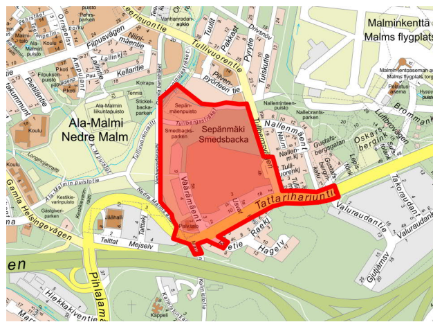
Kuva 1. Karttaote. Katujen ja puistojen suunnittelualue on esitetty punaisella viivalla.

Toivomme mahdollista palautetta 17.2.2026 mennessä.