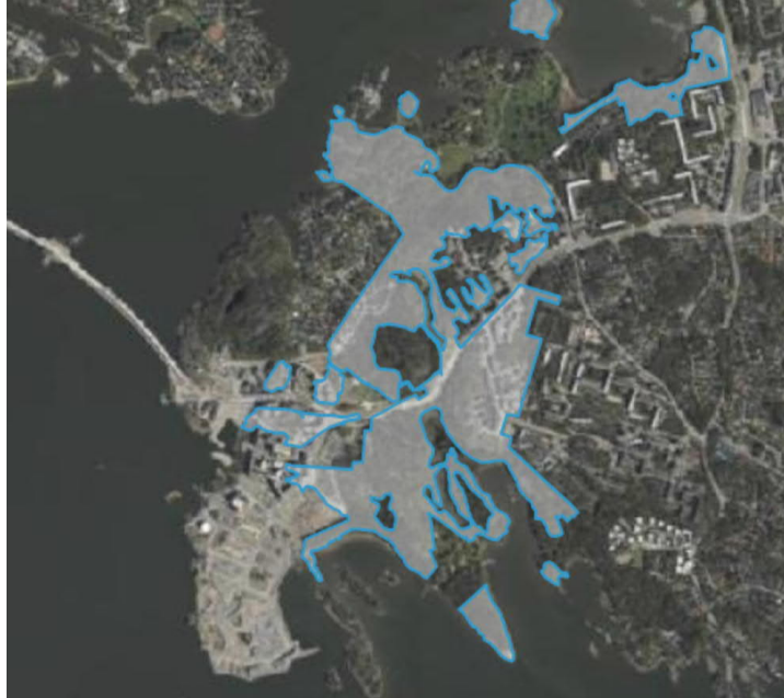
Kuvateksti: Kartta esittää aluerajausta: "Arvokkaat metsäkohteet Laajasalo Stansvik – Tullisaari"

3. Kruununlaiturinkuja - Pojamankatu (kortteli AL49325). Asemakaavasta näkee, kuinka Pojamonkadun akseli kurottuu 8-kerroksisen rakennuksen massaa sivuten kohti Kruunuvuoren öljysäiliötä. Näkymä on erityisen komea Pojamonkadun laelta. Suunnitelmassa KAO-32457 8-kerroksisen rakennuksen linjaviiva ei kuitenkaan näyttäisi olevan aivan samassa linjassa kuin Harkon Pojamonkadun puoleinen ulkoseinä (kuten asemakaavassa on). Kruununlaiturin alueen suunnitelman pyöreät ja kaarevat muodot eivät myöskään noudata asemakaavan johdonmukaista ja selkeää kaupunkirakennustaiteellista ideaa toisintaa tätä keskeistä akselia.