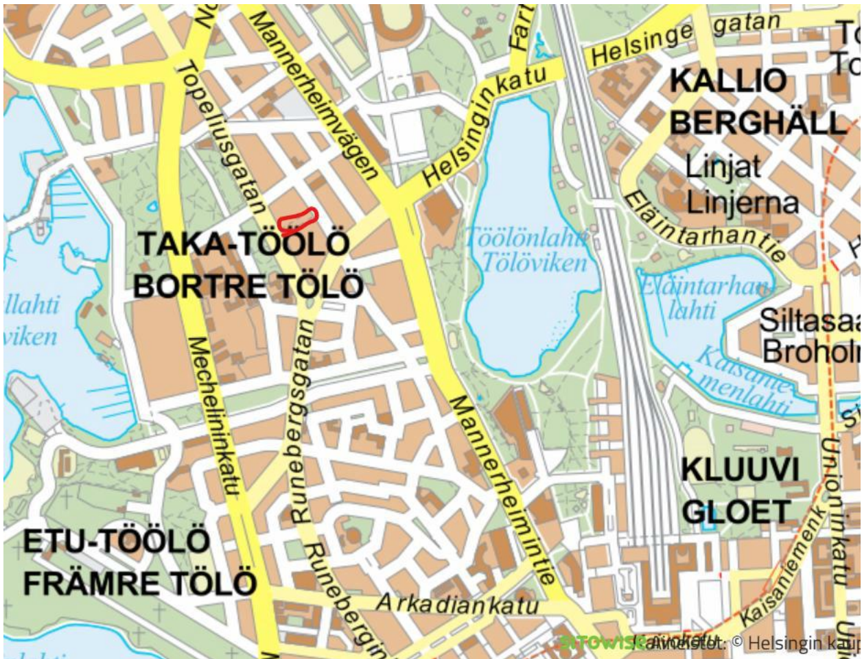
Kuva 1. Alueen sijainti kaupunkirakenteessa

Punaisen Ristin kuja on uusi katuyhteys, joka sijaitsee Töölössä Topeliuksenkadun ja Töölönkadun välissä. Kadun suunnittelu perustuu voimassa olevaan asemakaavaan 12491. Punaisen Ristin kujasta suunnitellaan jalankulku- ja pyöräliikenteelle varattua katua, jolla huoltoajo on sallittu. Kadun rakentamisella parannetaan alueen jalankulun yhteyksiä ja lisätään katuvihreää. Suunniteltava katu palauttaa Topeliuksenkadun ja Töölönkadun välisen katuyhteyden, joka katkaistiin 1950-luvulla Töölön sairaalan lisäosan rakentamisen yhteydessä.